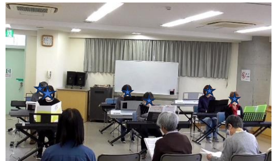
グループ発表の様子