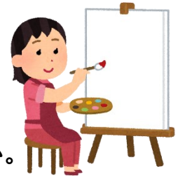
4月の予定表 詳しくはお問い合わせください。